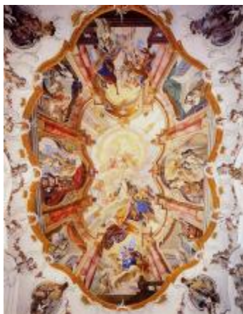
Deckengemälde in der Margaretenkapelle

(1) Nun weiß das mein Herr, der die lautere Wahrheit ist, dass ich seit jener Zeit soviel mir menschlich möglich war, mich ferngehalten habe in Gedanken, Worten und Werken von allen Dingen, die nicht Gott sind. Dennoch beunruhigte mich allzeit der Gedanke, dass ich nicht, wie ich sollte, entsprechend der Wahrheit lebte, die zwischen mir und Gott ist. Es kommen auch oft längere Zeiten, in denen mir nichts Sorgen macht. Selbst widerwärtige Nachrichten kann ich dann in Freude entgegennehmen. (...)