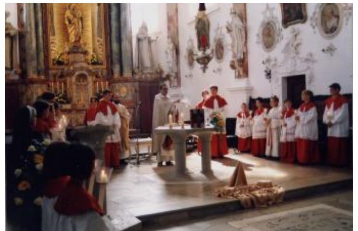
Festgottesdienst anlässlich des 650. Todestags der sel. Margarete Ebner

(2) Ich bitte dich, mein Herr, dass du uns in deiner lauterer Minne (Liebe) eine sichere Vereinigung mit dem höchsten Gut gebest, das du, Gott, selber bist. (...) Lass uns innwerden mit deiner Gegenwart - sichtbar und unsichtbar mit einer süßen Berührung; lass uns innwerden, was rechte, herzliche Liebe zu dir sei; lass uns zu nichts anderem hingezogen sein als zu deinem heiligen Leiden und zu deinen heiligen Sakramenten; gib uns eine wahre Lossagung von dieser ganzen Welt und einen vollen Verzicht auf uns selbst, eine reine Erkenntnis unserer Sünden, um sie aus rechter Minne (Liebe) zu bereuen und zu lassen, und gib uns einen bitteren Schmerz um all unsere verlorene Zeit in Gedanken, in Worten, in Werken und in aller Versäumung deiner süßen Gnade.