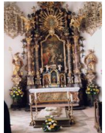
Kapelle mit Grab

In diesem Wachen nun hat mir Gott die wonnevollste menschlichste Ruhe gegeben. Sie kräftigt mich innerlich und äußerlich. Sie kommt mit Erleichterung und geht mit Freuden. Den ganzen Tag spüre ich dann eine Mehrung göttlicher Gnade und leiblicher Kraft. (...)