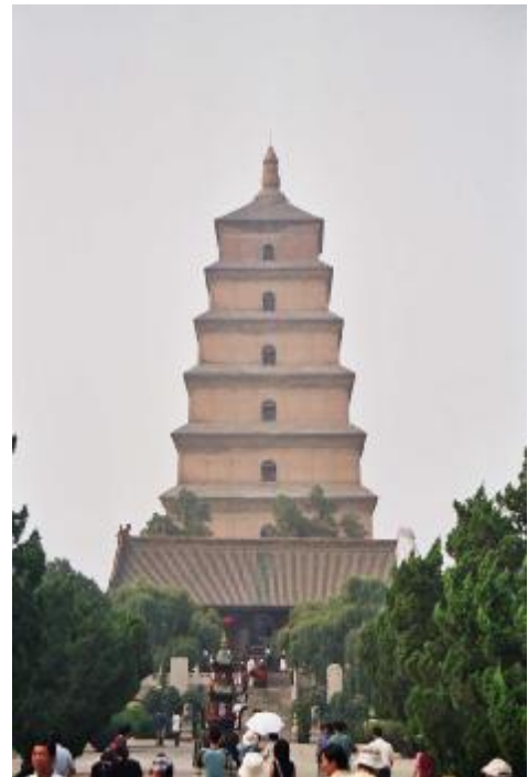
Pagode in Xi An

Seit Ende des vergangenen Jahrhunderts war ich nicht mehr in Shanghai und Xi An. So konnte ich sehen, was viele Chinabesucher beeindruckt: Die rasante wirtschaftliche Entwicklung; aus dem Boden schießende Hochhäuser in den Großstädten; Geschäftsstrassen, wo alles zu kaufen ist; Stadtteile von Shanghai, wo man nicht mehr spürt, im (offiziell) kommunistischen China zu sein. Negativ fiel mir auf: Die schwere Luftverschmutzung in Shanghai und Xi An; Zunahme der Armut: beim Gang auf der Strasse wird man als Ausländer von bettelnden Menschen manchmal aufdringlich verfolgt. Aus Berichten weiß man auch von der „Unheiligen Allianz“ mancher (offiziell sozialistischen aber bestechlichen und korrupten) Behörden mit brutal kapitalistischen Neureichen, welche als Investoren mit Hilfe von geheuerten Schlägern Bauern von ihrem Land und arme Bewohner aus ihren Häusern vertreiben und die vielleicht zugesagte – sowieso nur geringe – Entschädigung nicht den Enteigneten weitergeben. Von Bekannten hörte ich von der Not vieler Eltern, die es sich nicht leisten können, ihre Kinder