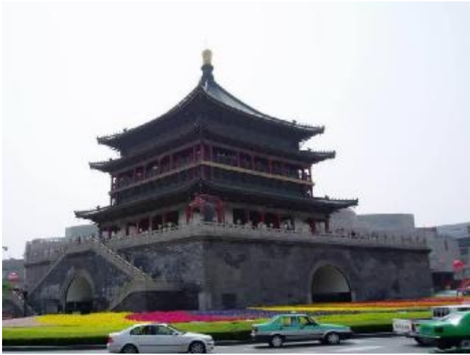
Wahrzeichen von Xi An: Glockenturm