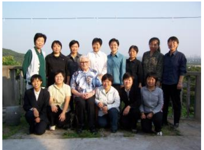
Beim Besuch der Novizinnen der Diözesankongregation von Shanghai