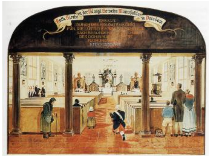
Innenraum der katholischen Kirche St. Peter und Paul, Potsdam. Der Text lautet: „Kath. Kirche in der königl. Gewehr-Manufaktur zu Potsdam. Erbaut durch den Soldatenkönig für die Lütticher Waffenschmiede nach besonderen Wünschen des Dominikaner-Paters Raimund Bruns MDCCXXXVIII“

Gebetsraum. Eine weitere Absicht des Herrschers ist dabei die Stärkung der Treue der Gläubigen zum Machthaber durch loyale Geistliche und eine größere Friedlichkeit durch den erhofften Trost der Religion.