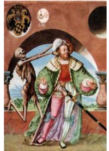
Der Tod und der Herzog