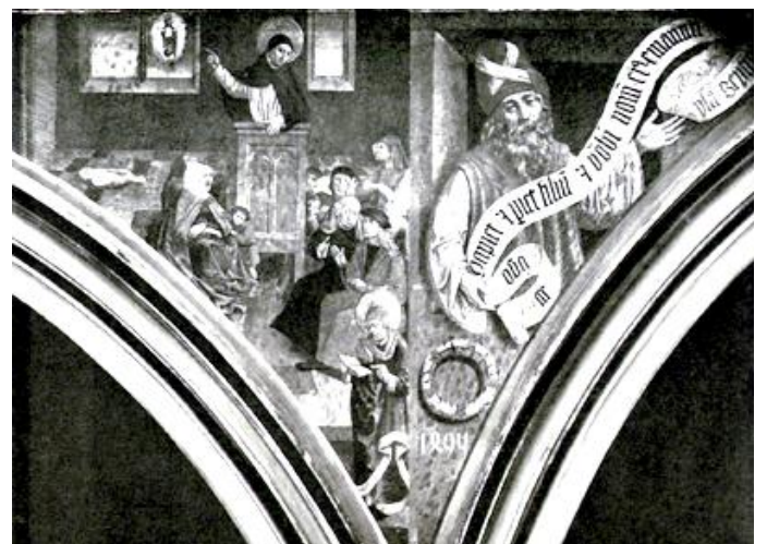
Lettnerstirn. Predigt des hl. Dominikus in Venedig und Prophet Jesaias.