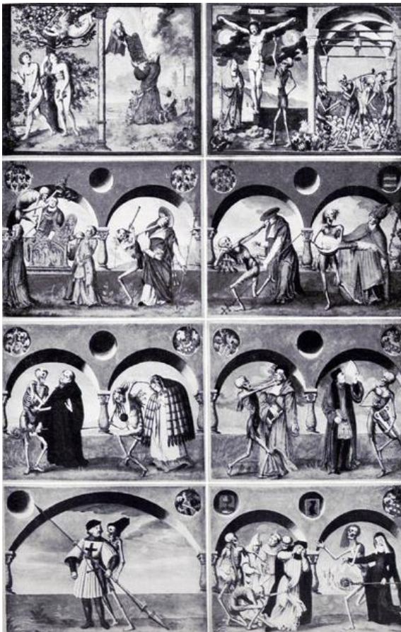
Totentanz des Niklaus Manuel, 1516/17 (Kopie von Albrecht Kauw).