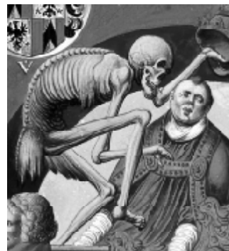
Der Tod und der Papst

Auf der südlichen Friedhofmauer des Klosters befanden sich die vor 1520 entstandenen und 1660 beim Abbruch der Mauer zerstörten Fresken von Niklaus Manuels Totentanz. Der Totentanz ist nur in Kopien erhalten. Die 48 Bilder und dazugehörigen Texte sind von 1516/17 bis um 1520 entstanden und zogen sich über mehr als 100 Meter hin; die Figuren mögen etwas weniger als lebensgroß gewesen sein. Schon kurz nach der Mitte des 17. Jahrhunderts fiel die Kirchhofmauer mit dem Totentanz der Verbreiterung der heutigen Zeughausgasse zum Opfer. Trotzdem ist dieses Werk von Manuel das populärste geblieben. So sind auch die »Totentanz«-Aufführungen 1991 vor dem Berner Münster wieder von diesem Werk des Malers und Dichters inspiriert.