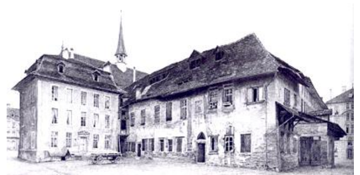
Predigerkloster; ehemaliges Konventgebäude von Nordosten (Aufnahme von 1898).

Ab 1623 diente die Kirche der protestantischen Kirchengemeinde französischer Sprache und wurde so nach 1685 zum Zufluchtsort für geflüchtete Hugenotten. Auch heute noch wird das Kirchengebäude von der französisch-sprachigen reformierten Kirchengemeinde genutzt, daher der Name Französische Kirche.