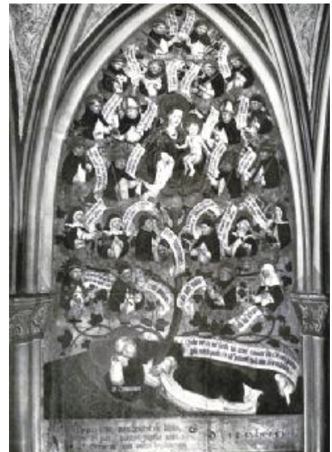
Lettner. Stammbaum des hl. Dominikus.

Der Lettner wurde 1495 mit Malereien des Berner Nelkenmeisters (Bezeichnung für eine Gruppe anonymer, mit zwei geschnittenen Nelkenblumen unterzeichnender Maler) versehen.