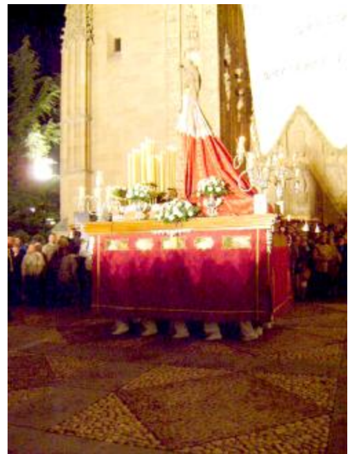
Prozession am Fest „Unsere Liebe Frau vom Rosenkranz“

Das erste große Fest ließ nicht lange auf sich warten. Am 7. Oktober, nach neun Tagen gepredigter Novene, wurde das Hochamt zum Rosenkranzfest zelebriert. Im Anschluss daran ging es auf die Stadtprozession samt Blaskapelle und einer drei Meter hohen Muttergottesstatue.