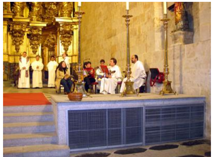
Jugendmesse in San Esteban

Der Verlag San Esteban publiziert regelmäßig theologische Werke und die Bibliothek der Fakultät ist auch für die Öffentlichkeit benutzbar – sei es für Theologiestudenten der Päpstlichen Universität, sei es für theologisch interessierte Frauen und Männer.