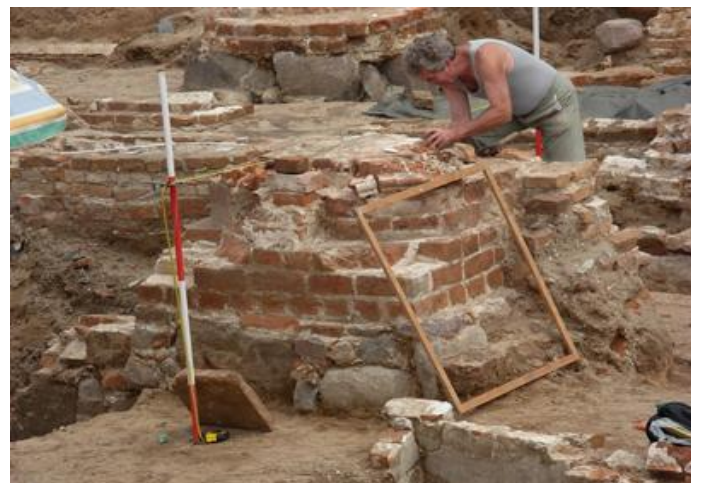
Arbeiten an einem Pfeiler der Kirche.

Überblickt man die frühe Ordensgeschichte in Berlin, ist am bemerkenswertesten daran wohl der Pioniergeist bereits der zweiten und dritten Generation: der Orden investierte vielfach in bedeutendere Städte als die Gründungen der Askanier im märkischen Sand welche waren. Aber die Tatsache, dass hier eine Stadtgründung vor sich ging (Berlin und Cölln wurden gleich als Städte gegründet und entwickelten sich nicht aus Siedlungen dazu, Spandau besaß eine Burg), rief einige Predigerbrüder auf den Plan, die dort wirkten.