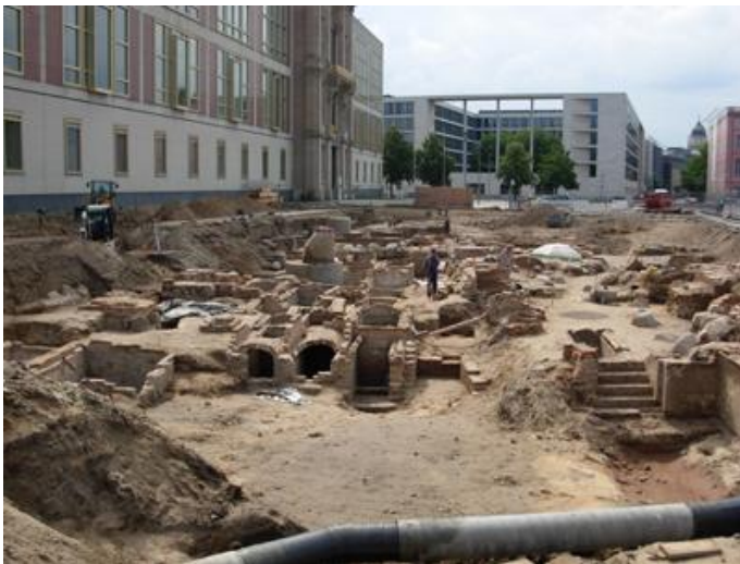
Die Ostseite der Dominikanerkirche.

und kostbare Wandteppiche zählten zur Innenausstattung. In der Folge wurde sie auch Grablege der brandenburgischen Kurfürsten und der Hohenzollern, der erste König in Preußen war allerdings noch in einer Gruft der Dominikanerkirche beigesetzt worden.