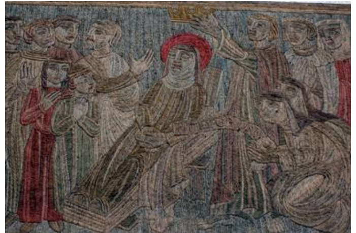
Ausschnitt Elisabethenbehang in Augsburg, St. Elisabeth

ausgearbeitet; sie alle besaßen ein solides handwerkliches Fundament, reiche Kenntnisse über Stoffe und Garne und waren im freien Sticken geübt und erfahren.