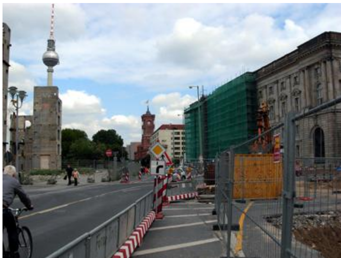
Reste des Palastes der Republik vor dem Fernsehturm, in der Mitte der Turm des Berliner Rathauses, rechts der Beginn des Grabungsareals.

Berlin Mitte bleibt vorläufig eine Art Bundesbaustelle, was für die dominikanische Spurensuche jedoch zu einem unverhofften Glücksfall wurde. Bei diesen Straßenarbeiten wurden nämlich die Reste der alten Berliner Dominikanerkirche freigelegt.