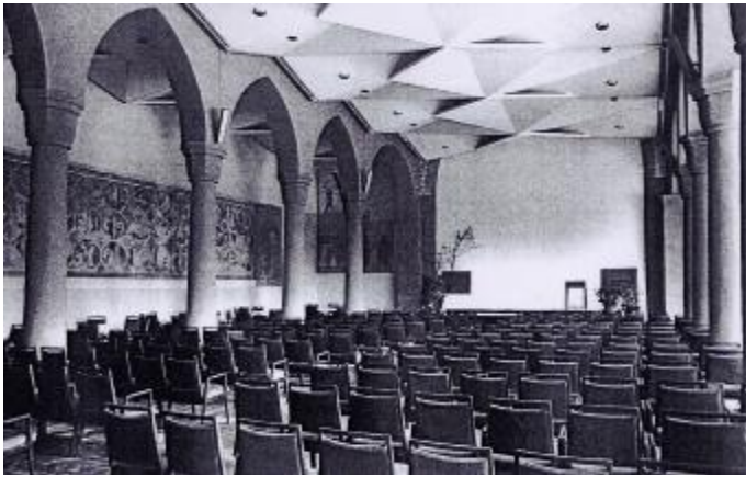
Der Festsaal im Kirchenschiff (1970)