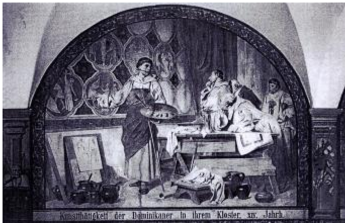
Eines von 26 Monumentalgemälden mit Szenen aus der Geschichte der Klosterinsel, entstanden 1886-96 (Foto 1970)

Fotos aus dem Jahr 1874 lassen über der mittelalterlichen Bemalung eine helle Tünche und zarten Bandelwerkstück erkennen. Über den Säulenachsen wurden offenbar kartuschenartige Bildtafeln aufgehängt, unter denen die mittelalterliche Quadermalerei erhalten blieb.