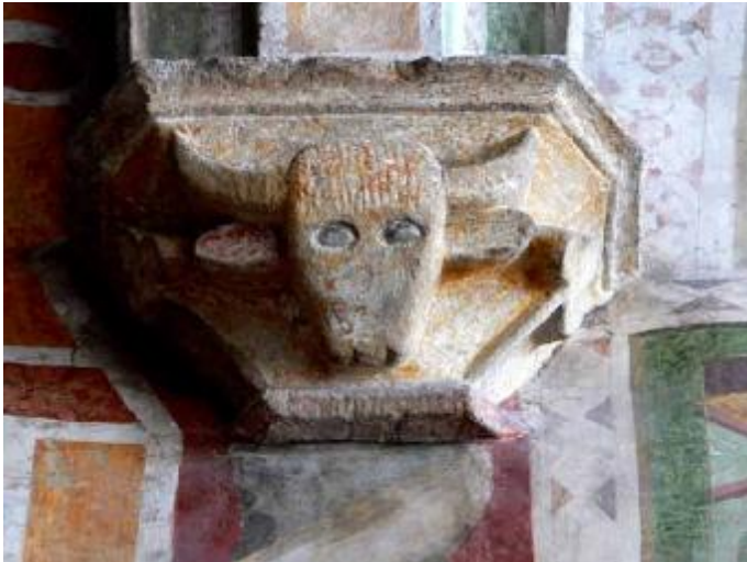
Die sehr „provinziellen“ Konsolen in der Johanneskapelle stehen in einem interessanten Kontrast zur erstklassigen Freskenausstattung.

weist Gestaltungselemente aus drei verschiedenen Epochen auf. Die Malereien aus dem 14. Jh. sind nur mehr teilweise erhalten. Sie wurden durch den Einbau des spätgotischen Gewölbes in Mitleidenschaft gezogen. Bei diesem Eingriff gingen viele Darstellungen verloren, und viele der neuen Gewölbeflächen blieben unbemalt. Die Dekorationen, die Anfang des 16. Jh. mit der Technik der Trockenmalerei angefertigt wurden, sind ebenfalls stark beschädigt, da die Farbe bei dieser Maltechnik eine geringe Haltbarkeit hat.