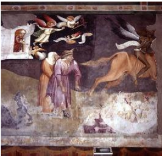
Johanneskappelle. Meister der Dominikaner: „Triumph des Todes“ (Detail)

und Katherinenkapellen, im Kapitelsaal und im Kreuzgang sind ab 1329 Künstler am Werk, die sich die figurativen Erneuerungen Giotto's zu eigen machen und sie in Norditalien verbreiten.