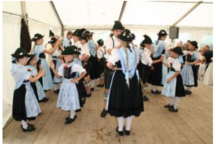
Die Kindergruppe des Trachtenvereins Griesstätt bei ihrem Auftritt.