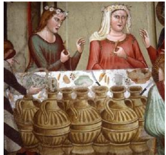
Johanneskappelle. Meister der Dominikaner: „Hochzeit von Kanaa“ (Detail).

Erhalten geblieben ist auch ein Beispiel barokker Kunst, nämlich ein großes, von Guercino gestaltetes Altarbild, das die "Vision von Sorano" zeigt, ein wunderbares Ereignis, das sich 1530 im Dominikanerkloster von Soriano Calabro zugetragen haben soll.