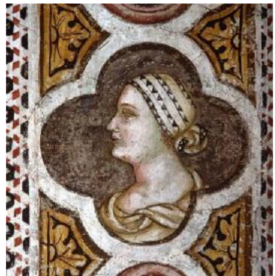
Innen. Meister der Madonna Castelbarco: „Thronende Madonna mit Kind“ (Detail des Rahmens).

Bis zu seiner Auflösung 1785 durch Kaiser Joseph II. war das Kloster jahrhundertlang ein wichtiger religiöser und kultureller Bezugspunkt für die Stadt Bozen. Im 19. Jh. wurde der Komplex teilweise abgebrochen, weitere Schäden entstanden bei einer Bombardierung der Klostergebäude und des Glockenturms der Kirche gegen Ende des Zweiten Weltkriegs.