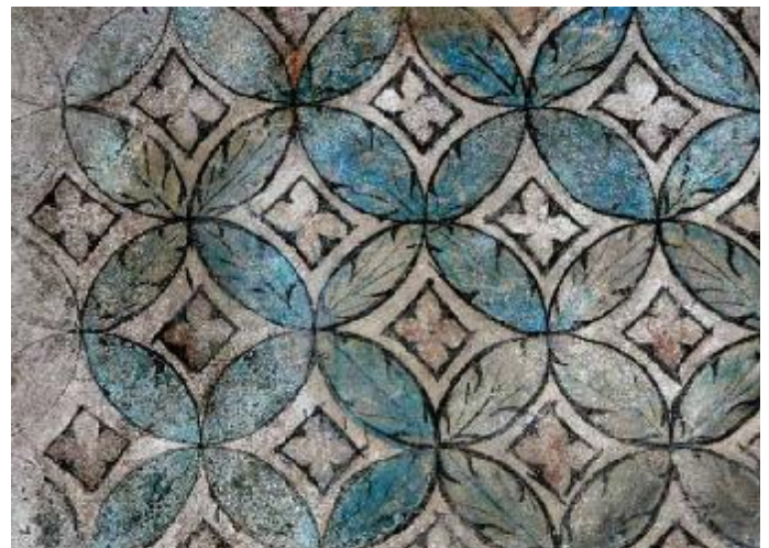
Bemalte Sitznische im Chor