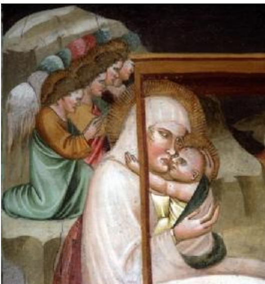
Johanneskappelle. Meister der Dominikaner: „Christi Geburt“ (Detail).

Die Johanneskappelle ist vollständig mit Darstellungen aus dem Marienleben, der Nikolauslegende, Legende von Johannes dem Täufer und Legende des Evangelisten Johannes ausgemalt.