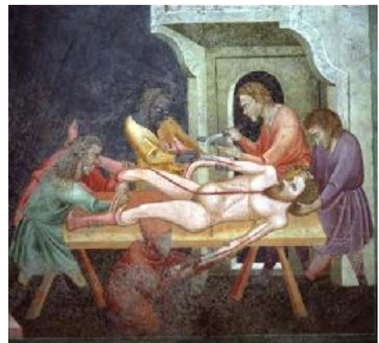
Johanneskapelle. Meister der Dominikaner: „Martyrium des Hl. Bartolomäus“.