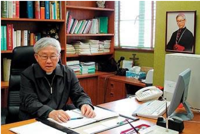
Bischof Joseph Zen Ze-Kiun am Schreibtisch seines Amtssitzes in Hongkong

Da der Bischof in Bonn, Berlin und in (der Partnerdiözese Hongkongs) Essen Besuche machen und Berichte geben und noch in seine Diözese zurückkehren wollte und doch bald zur Feier der Erhebung zum Kardinal in Rom sein musste, verabschiedeten wir uns in sehr herzlicher Weise am Sonntag 12. März nach einem kurzen sehr freudigen Wiedersehen.