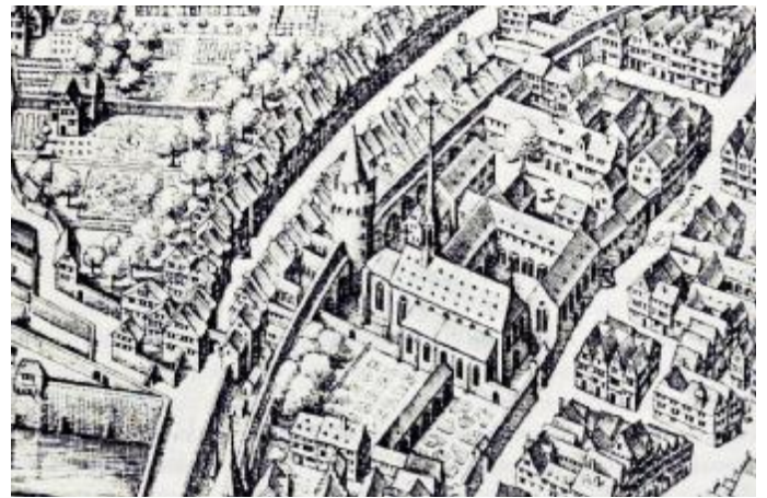
Kloster um 1628

Die Reformation ging auch am Dominikanerkonvent nicht spurlos vorbei. In den Jahren nach 1524 kündigte der Rat der Stadt Frankfurt den Dominikanern ihre Steuerbefreiung auf, und sie wurden zu allen bürgerlichen Lasten und Pflichten herangezogen. 1633 untersagte der protestantische Stadtrat dem katholischen Klerus sogar die öffentliche Abhaltung von Gottesdiensten im Stadtgebiet. Die Dominikaner und Dominikanerinnen konnten jedoch, weil sie in Frankfurt Bürgerrechte hatten, in ihren Klöstern bleiben und ihr religiöses Leben fortsetzen.