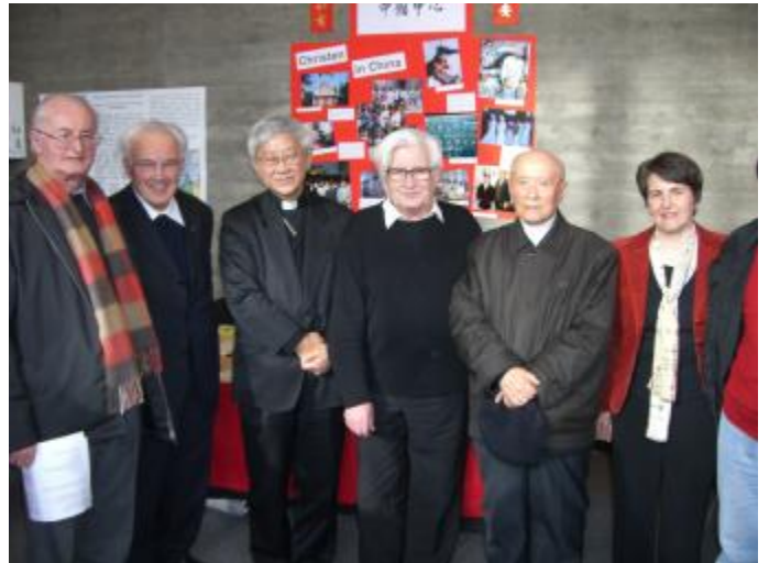
Treffen mit Kardinal Zen in St. Augustin

So kam es auch, zumal am 22. 2. seine Erhebung zum Kardinal angekündigt wurde. Von dieser Ernennung erfuhr ich am gleichen Tag durch einen Anruf aus dem China-Zentrum in St. Augustin, welches die Organisation des Besuchs des Bischofs in Deutschland übernommen hatte. Eine Mitarbeiterin am China Zentrum teilte mir mit, der Bischof habe ausdrücklich nach mir gefragt. Ich wurde eingeladen, nach dem Kongress in Augsburg mit dem Bischof nach St. Augustin ins Zentralhaus der Steyler Missionare (SVD) zu kommen. So geschah es auch.