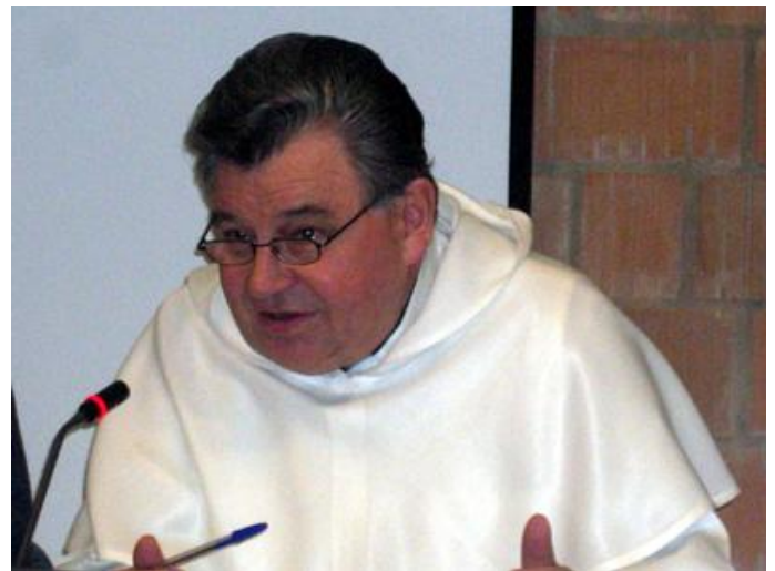
Bischof Dominikus Duka OP

die Pastoral. Fünf Einzelberichte vermittelten dazu überraschende Einsichten. Die Außenbezirke von Paris z.B. erleben keineswegs nur eine Einwanderung von Moslems, sondern von zahlreichen afrikanischen Katholiken, die neue, sehr rege Gemeinden bilden. In der Diasporasituation Schwedens wächst der Anteil der Katholiken durch „Migration“ deutlich; das Hauptproblem ist nicht Integration als solche, sondern die organisatorische Fassung der vorhandenen Vielfalt von Sprachen und Riten. Das zweite Leitthema „Zusammenarbeit zwischen Bischöfen und Dominikanerorden“ erwies sich ebenfalls als sehr interessant: abgesehen vom Bereich „Forschung und Lehre“ kommt es da oder dort zu Problemen, wenn der Orden zu seiner apostolischen Sendung steht und jenseits zuweilen sehr engmaschiger Diözesanstrukturen wirkt. Zu unserer großen Freude nahm Bischof Dominikus Duka OP für drei Tage am IEOP-Treffen teil und bereicherte die Diskussion mit seiner Erfahrung und seinen Einsichten.