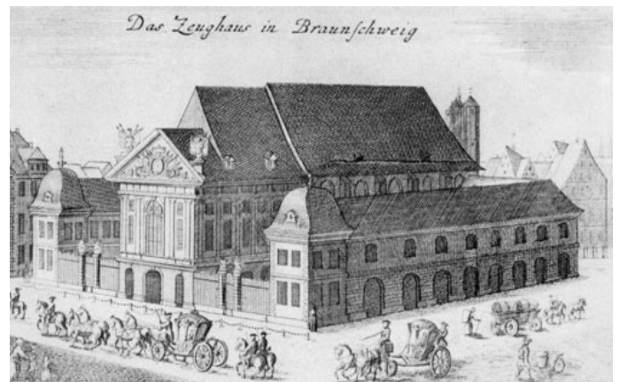
Das Zeughaus in Braunschweig

Andere mögen nach Braunschweig wegen seiner reichen Geschichte fahren, wegen des Löwens, des Doms, dem Kloster Riddagshausen und der historischen Kirchen. Aber die Sehenswürdigkeiten der niedersächsischen Metropole beschränken sich nicht nur auf Altes – noch dazu, weil die Stadt, einstmals des Deutschen Reiches größte und schönste Fachwerkstadt, unter den Bombenangriffen des zweiten Weltkrieges und ihrem Wiederaufbau als „autogerechte Stadt“ nach 1945 nicht unbedingt nur gewonnen hat. Das beste Beispiel dafür ist der Dominikanerkonvent: Schon 1294 war den Predigerbrüdern erlaubt worden, sich in Braunschweig niederzulassen, aber es hatte bis 1307 gedauert, bis sie endlich kamen. Streitigkeiten mit dem Stadtklerus verzögerten den Auf- und Ausbau ihrer Niederlassung, sodaß erst 1343 eine erste Dominikanerkirche konsekriert werden konnte. Dies bedeutete nicht, daß diese dadurch schon fertig gewesen wäre – den Rest des 14. und beinahe das ganze 15. Jahrhundert wurde weiter daran gebaut, nur um sie sich 1528 von den Protestanten wegnehmen lassen zu müssen, als Braunschweig am 6. September diesen Jahres offiziell das evangelisch-lutherische Bekenntnis annahm.