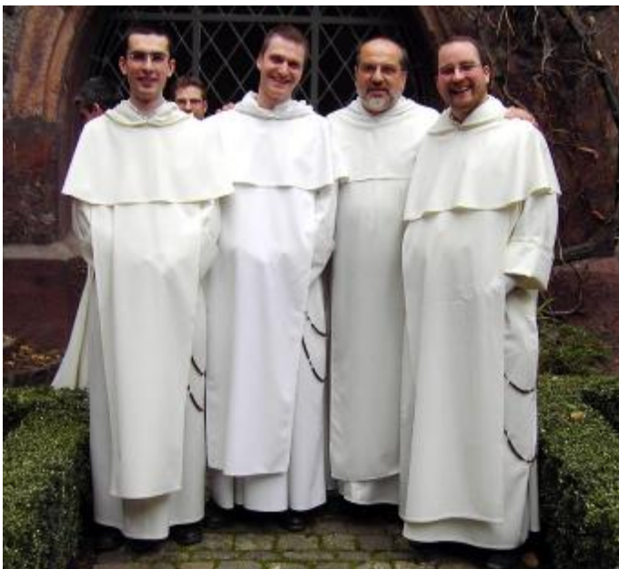
Noviziat mit Ordensmeister

Am 13. und 14. Februar kamen wir in den für Novizen wohl eher seltenen Genuss, einer Visitation durch den Ordensmeister beiwohnen zu dürfen.