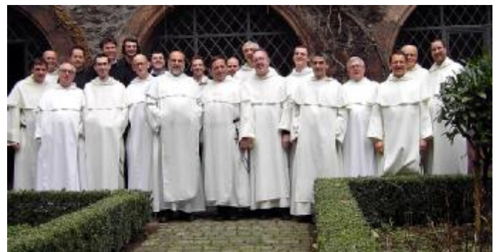
Wormser Konvent mit Ordensmeister