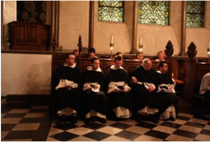
Wohl zum ersten Mal seit 730 Jahren versammeln sich Dominikaner in der Kapelle von Lambeth Palace zur Komplet

Residenz des Erzbischofs – und fast alle Mitbrüder aus Oxford waren mit dabei. Eine solche Ansammlung von Dominikanern an diesem „heiligen Ort“ der Anglikaner hat es wahrscheinlich das letzte Mal in den 1270er Jahren gegeben. Damals saß allerdings ein Dominikaner auf dem Stuhl von Canterbury.