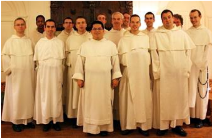
Das Studentat in Oxford am Beginn des akademischen Jahres, Oktober 2008