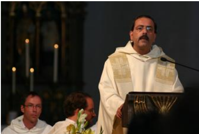
Geistliches Rahmenprogramm der Dominikaner in St. Blasius anlässlich des Papstbesuchs in Regensburg