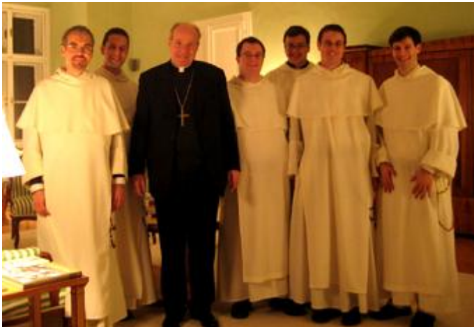
Gruppenbild mit Kardinal Schönborn OP