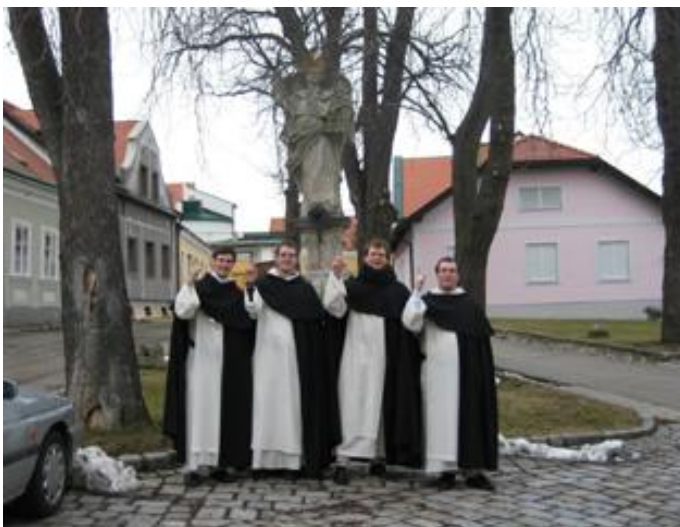
Ein Abstecher nach Retz, vor der Vinzenz-Ferrer-Statue