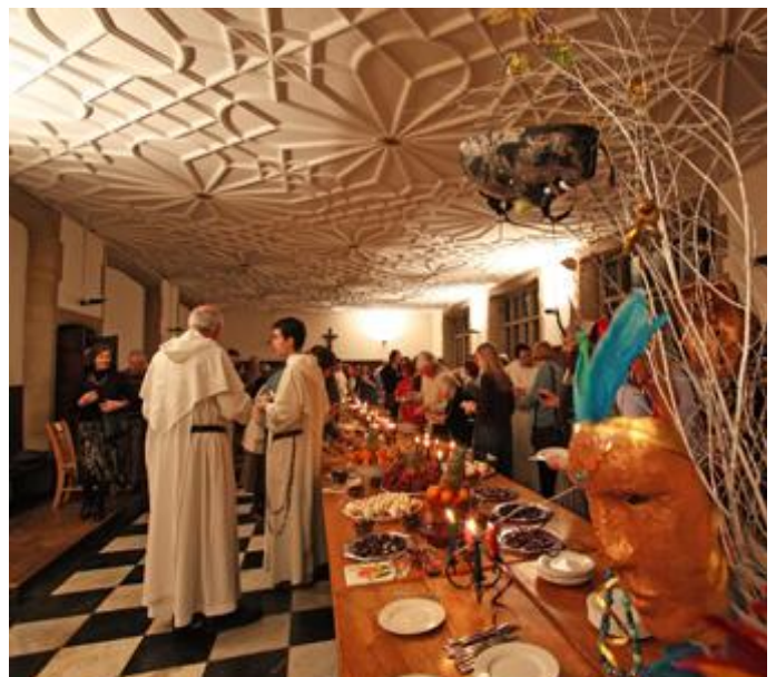
Fundraising-Karneval-Dinner für Freunde von Blackfriars