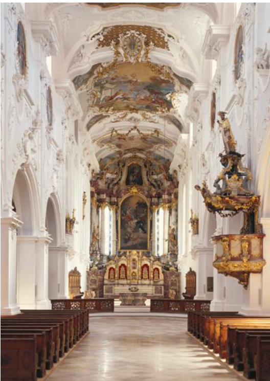
Östliches Langhaus mit Blick auf Chor und Hochaltar

Die Landshuter Dominikanerkirche gehörte zu dem 1271 gegründeten und im Jahre 1802 aufgehobenen Kloster der Dominikaner. Sie war eine der ersten Bettelordenskirchen Bayerns und gehört noch heute zu den schönsten Denkmälern in Landshut und zu den ältesten Großbauten der altbayerischen Backsteingotik.