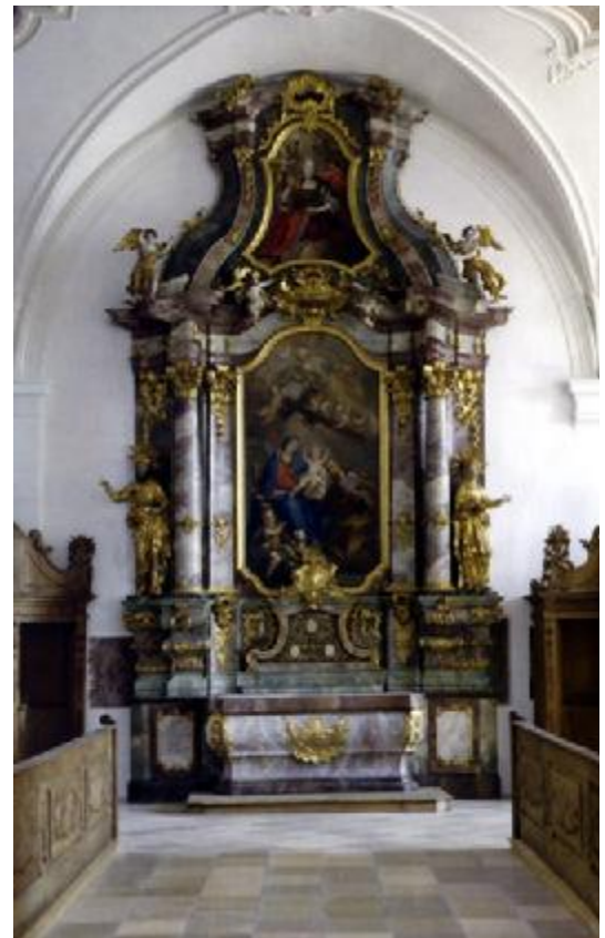
Altar der Hl. Familie, südliche Langhauswand

Das Hochwasser zu Pfingsten 1999 und der damit verbundene hohe Grundwasserstand hatten zur Folge, dass sich die Kirchenpfeiler setzten und starke Risse im Mauerwerk auftraten. Auch die Dachstühle der Kirche und Seitenkapellen zeigten im Laufe der Zeit so starke Schäden, dass eine statische Sicherung und die Sanierung der konstruktiven Bauteile unbedingt erforderlich geworden waren. Die Instandsetzung der Dächer, Dachtragwerke, Fundamente, Pfeiler und Fassaden sind zwischenzeitlich ebenso abgeschlossen, wie die Sanierung des Innenraums von Langhaus und den beiden Seitenschiffen. Im Zuge der Renovierungsarbeiten entdeckte man in der Magdalenenkapelle die intakte Gruft der Dominikaner-Mönche für den Bestattungszeitraum von 1773 bis 1801. Bis Mitte 2007 wurden noch das Chorgestühl sowie die Beichtstühle mit einem Harz- und Ölüberzug versehen, um dem barocken Erscheinungsbild zu entsprechen.