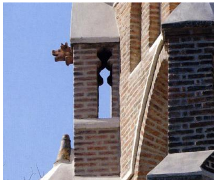
Detail des südöstlichen Strebepfeilers. Am obersten Pfeilergeschoss ragt ein Schweinskopf aus der Fiale, darunter ist eine Kanne zu erkennen. Diese Steinmetzkapriole gab zu einer Sage Anlass.