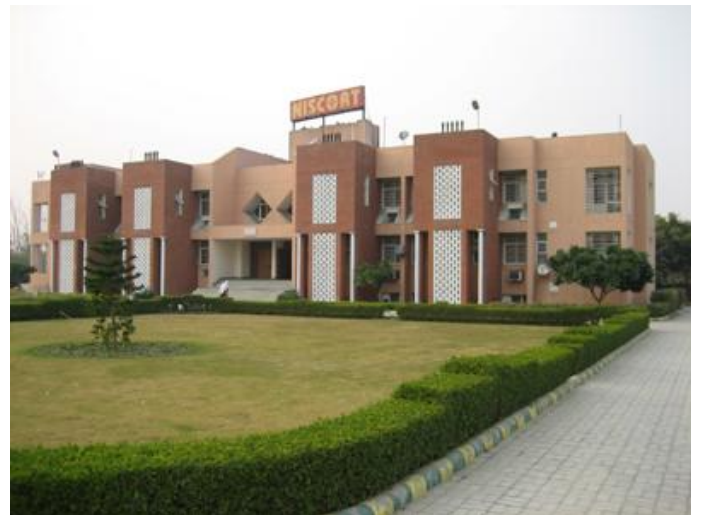
Ausbildungszentrum für Kommunikation, Delhi

Ein schönes Erlebnis war in Nagpur die Begegnung mit den Studenten, deren Dynamik, Einsatzbereitschaft und Wissensdurst tief beeindruckt. Ich konnte einige interessante neue Projekte kennen lernen: In Delhi wurde von der indischen Bischofskonferenz ein hochmo-