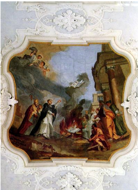
Deckengemälde, signiert „Zimmerman inv(enit) et pinxit ano 1749“: Der hl. Dominikus verbrennt häretische Bücher