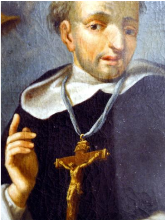
Dominikus-Altar, Gemälde im Auszug

1802 brach die Säkularisation über das Kloster herein: Die Mönche wurden in das Zentralkloster Mödingen bei Dillingen verfrachtet; das Vermögen ging an den Staat über, d. h. an den Universitätsfond.