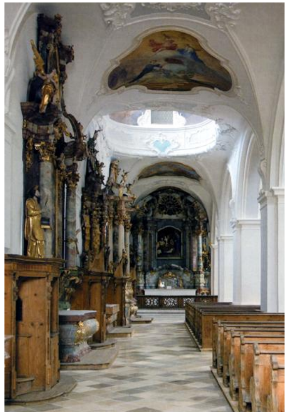
Nördliches Seitenschiff mit Lichtkuppel