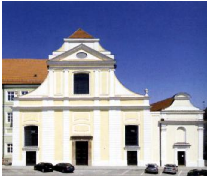
Westfassade mit klassizistischer Gliederung von 1804

1271 zogen die Predigerbrüder in Landshut ein und begannen zügig mit ihrem Bauprojekt: Ab 1288 wurden Ablässe für den Bau der neuen großen Klosterkirche erlassen. 1289 war der Landshuter Konvent vom Regensburger Dominikanerkloster gelöst worden. Die Landshuter Kirche fußt deutlich auf dem Regensburger Vorbild, entwickelt es aber weiter, z.B. hinsichtlich der architektonischen Gliederung im Mönchschor